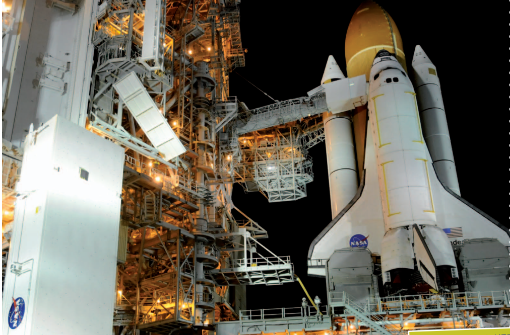
CERN-Technik auf großer Fahrt: Mit dem letzten Shuttle-Flug der Raumfähre Endeavour hob auch der AMS-Detektor ab (hier noch an der Startrampe) - er soll von der ISS aus das Rätsel der Dunklen Materie aufklären.