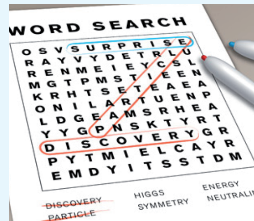
Wie in einem Suchrätsel fahnden die Wissenschaftler nach unentdeckter Physik.

Doch es gibt noch ein weiteres Kriterium, das stets angewendet wird und das bei den Ergebnissen, die die CDF-Kollaboration vorgestellt hat, noch aussteht. Es ist die Reproduzierbarkeit von Ergebnissen an anderen Orten und von anderen Detektoren. Am LHC zum Beispiel suchen ATLAS und CMS nach den gleichen Phänomenen.