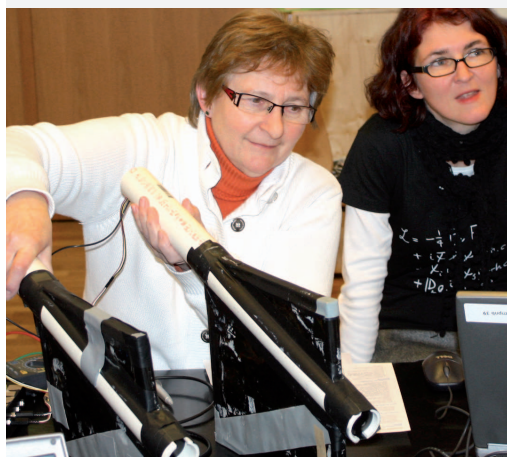
Lehrkräfte bei der Messung kosmischer Teilchen mit einem Szintillationszähler-Experiment.