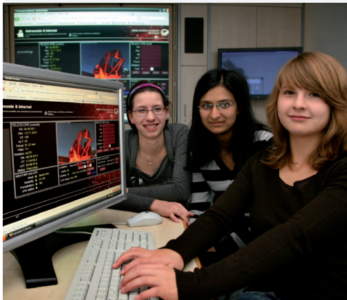
Schülerinnen beobachten im Projekt „PlanetFinders“ ferne Welten mit einem MONET Teleskop.