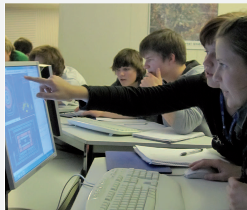
Bei den International Masterclasses 2011 konnten die Teilnehmer zum ersten Mal mit echten Daten vom LHC arbeiten.