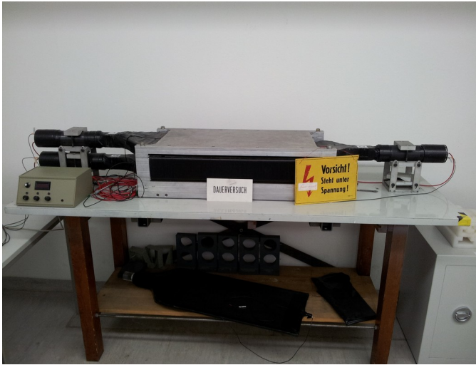
Abb. 3: Versuchsanordnung