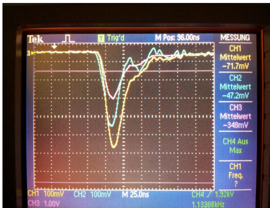
Abb. 1: Monitor eines Oszillographen