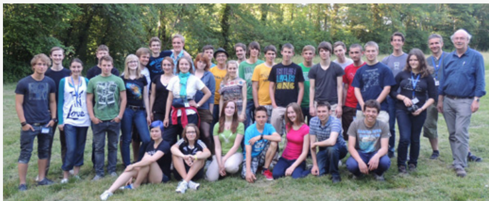
Die TeilnehmerInnen des CERN-Workshops im Juni mit Wissenschaftlern beim Abschlussfoto ihres dreitägigen Workshops am CERN. Der nächste Workshop ist im November 2012. Eine Bewerbung dafür ist vom 10. bis 20. September möglich.

Der Donnerstag stand ganz unter dem Motto „CERN und seine Beschleuniger“. So besuchten wir zum Beispiel den Antiprotonen-Entschleuniger, der Antiprotonen abbremst, um sie zu untersuchen. Wie bekämpft man mit Antimaterie Tumore oder wie verhält sich Antiwasserstoff im Vergleich zu „normalem“ Wasserstoff? Spannende Fragen blieben dort nicht aus. Die Mythen, die sich durch Hollywood in der allgemeinen Bevölkerung verbreitet haben, „Antimaterie könne man einfangen und zu einer Bombe umfunktionieren“, konnten zum Glück