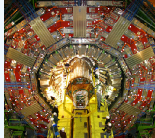
Die beiden großen Detektoren CMS und ATLAS suchen beide nach dem Higgs-Teilchen. Hier zu sehen ist das CMS-Experiment bei der Installation des Silizium-Trackers.

Es gibt verschiedene Möglichkeiten, wie ein Higgs-Teilchen zerfällt, deren Häufigkeit auch noch von seiner genauen Masse abhängt. Mit einer Masse zwischen 115 und 130 Gigaelektronenvolt sollte das Higgs-Teilchen am häufigsten in ein b-Quark und dessen Antiteilchen zerfallen. Ausgerechnet dieser Zerfallskanal ist jedoch am LHC besonders schwer zu beobachten, da in anderen Prozessen des Standardmodells mehr b-Quarks entstehen, die die b-Quarks aus Higgs-Zerfällen überdecken. Leichter könnte das Higgs-Teilchen bei einem Zerfall in zwei Photonen entdeckt werden. Doch bei einem Higgs-Teilchen, wie es vom Standardmodell vorhergesagt wird, ist dieser Zerfall sehr selten.