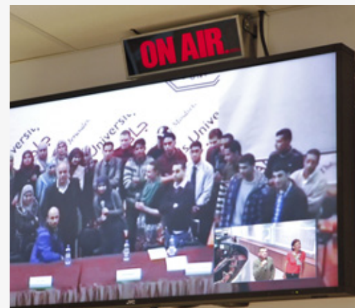
„Virtuelle BesucherInnen“ der palästinensischen Al-Quds-Universität im Gespräch mit ATLAS-WissenschaftlerInnen am 2. April 2012.