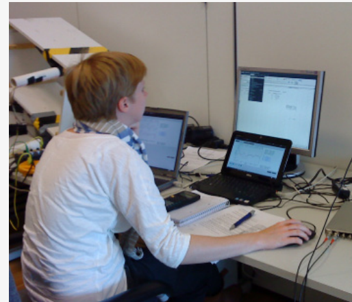
Eine Schülerin misst Myonen beim International Cosmic Day in Zeuthen.