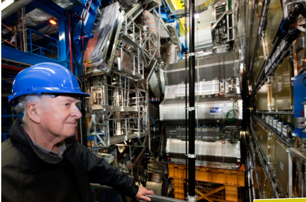
Peter Higgs - einer der fünf Wissenschaftler, die die Existenz des Higgs-Bosons postulierten - bei der Besichtigung des ATLAS-Detektors 100 Meter unter der Erde.