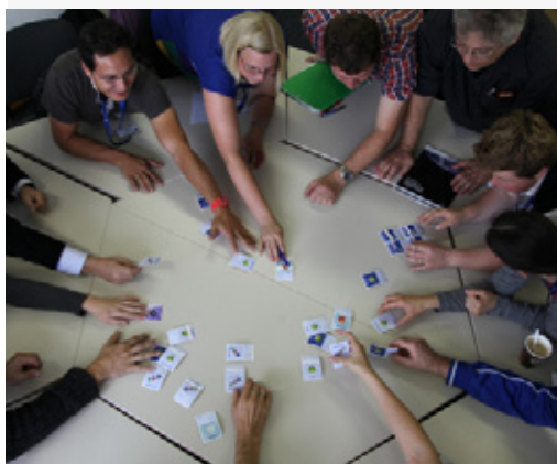
Beim CERN-Workshop im Oktober testeten Lehrkräfte die Lernmethoden mit den neuen Elementarteilchen-Steckbriefen.

Auf der Webseite www.teilchenwelt.de/material/materialien-fuer-lehrkraefte sind brandneue Materialien zur Teilchenphysik zu finden. Beispielsweise ist eine Anleitung und Informationen zum Selbstbau einer Nebelkammer online, sowie Handouts für Masterclasses.