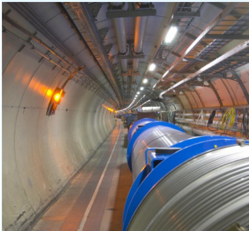
Der LHC-Tunnel in Genf liegt hundert Meter unter der Erde.

Bereits im März hatte CERN angekündigt den LHC 2012 für eine Wartungsphase abzuschalten. Die Zeit soll für die Vorbereitung des Betriebes des Beschleunigers bei seiner geplanten Energie von 14 Teraelektronvolt genutzt werden. Doch wie sieht die weitere Zukunft aus?