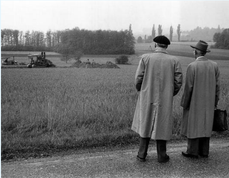
Die ersten Erdarbeiten beim Bau des CERN im Mai 1955.

Was heute mehr als 13.000 Wissenschaftler aus über 90 Nationen sind, die alle gemeinsam forschen, um den Geheimnissen der Natur etwas näher zu rücken, war vor etwas mehr als 60 Jahren nur eine Idee – die Idee, die europäische Forschung nach dem zweiten Weltkrieg zu stärken, zu