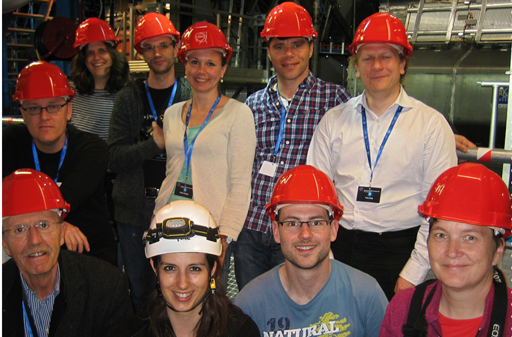
Beim Besuch des Atlas-Detektors herrscht auch für unsere Workshop-Teilnehmer Helmpflicht. Ein Team aus Lehrkräften und Wissenschaftlern arbeitete eine Woche lang an Lehrmaterialien für den Einsatz im Unterricht.