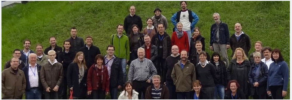
38 Lehrkräfte haben letzten Herbst am CERN-Workshop teilgenommen.

Ein Experiment, das auch im Unterricht leicht umzusetzen ist, bauen die Teilnehmer im Nebelkammer-Workshop: Eine durchsichtige Kunststoffbox, eine schwarze Metallplatte, Trockeneis und ein mit Alkohol getränkter Filz reichen aus, um Teilchenspuren