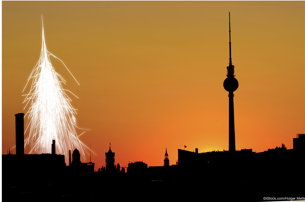
Teilchenschauer über Berlin: Die Montage zeigt, wie aus einem Primärteilchen durch Zusammenstöße mit Luftmolekülen eine ganze Teilchenkaskade entsteht.