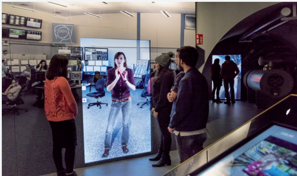
Echte CERN-Physikerinnen und -Physiker geben im CERN-Museum Microcosm auf lebensgroßen Bildschirmen Auskunft über ihre Arbeit – und zwar in mehreren Sprachen.

WELTMASCHINE.DE IST DIE INTERNETSEITE DER DEUTSCHEN TEILCHENPHYSIKER. GEMEINSAM MIT DER WANDERAUSSTELLUNG WELTMASCHINE INFORMIERT SIE ÜBER DIE FORSCHUNG AM LHC, DAS CERN, DIE RÄTSEL DES UNIVERSUMS UND DER MODERNEN PHYSIK, DIE TECHNIK UND DIE MENSCHEN.