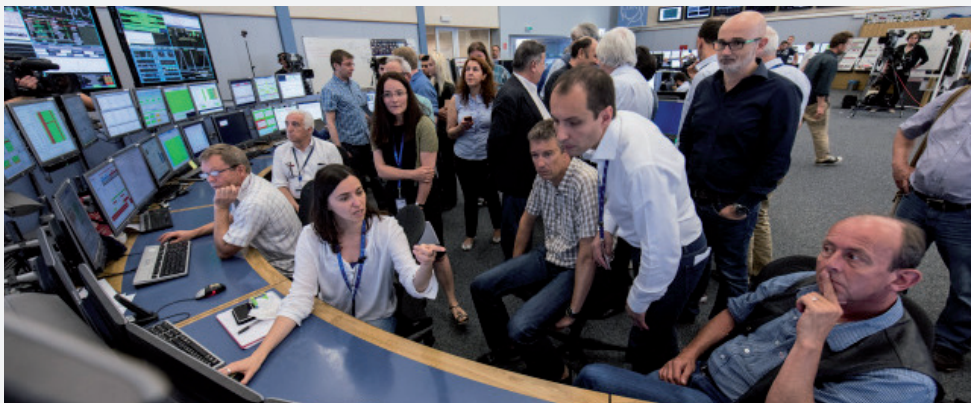
Von diesem Kontrollzentrum werden die Teilchenstrahlen gesteuert.