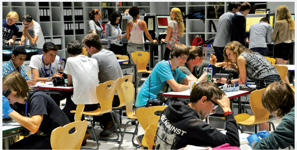
In kleinen Gruppen arbeiten Jugendliche selbstständig mit Experimenten im S'Cool Lab am CERN.

Aus ganz Europa und sogar aus Israel, Brasilien, Singapur oder Pakistan kommen inzwischen Anfragen für das Programm. Entsprechend hart umkämpft sind