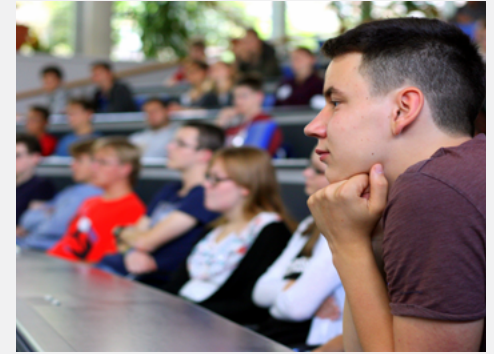
Gespannt lauschen die Anwesenden der Eröffnungsrede von Rolf-Dieter Heuer.