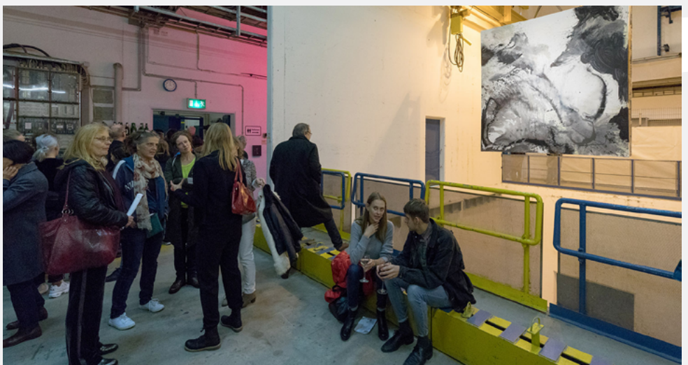
DESY Hamburg beweist, dass Kunst und Wissenschaft sehr gut zusammenpassen.