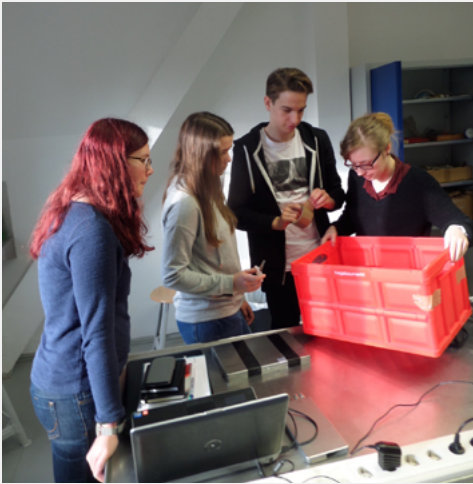
Die Schülerinnen und Schüler des Villa Elisabeth Gymnasiums packen an.

Am 30. November 2017 fand erneut der International Cosmic Day (ICD) statt: ein Tag, an dem Schülerinnen und Schüler kosmische Teilchen nachweisen. Nach einer Einführung zu kosmischer Strahlung und Teilchenphysik galt es die Messgeräte in Betrieb zu nehmen und der Untersuchungsaufgabe des Tages nachzugehen, um die Ergebnisse in einer Videokonferenz mit Jugendlichen aus aller Welt zu teilen. Konferenzsprache: natürlich Englisch.