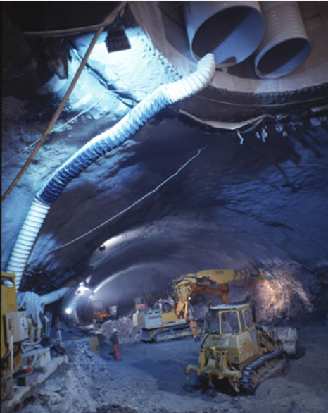
Hier wurde zwanzig Jahre später das Higgs-Teilchen entdeckt.

WELTMASCHINE.DE IST DIE INTERNETSEITE DER DEUTSCHEN TEILCHENPHYSIKER. GEMEINSAM MIT DER WANDERAUSSTELLUNG WELTMASCHINE INFORMIERT SIE ÜBER DIE FORSCHUNG AM LHC, DAS CERN, DIE RÄTSEL DES UNIVERSUMS UND DER MODERNEN PHYSIK, DIE TECHNIK UND DIE MENSCHEN.