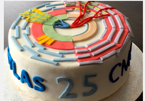
Happy birthday ATLAS und CMS!

Nächstes Jahr soll der massiv umgebaute Belle II-Detektor am japanischen Forschungszentrum KEK seinen Dienst wieder aufnehmen. Forscher haben jetzt eine zentrale Komponente tief im Innern eingebaut: den BEAST-Detektor. Er bereitet den Boden für den neuen und zu großen Teilen in Deutschland gebauten, zentralen Vertexdetektor.