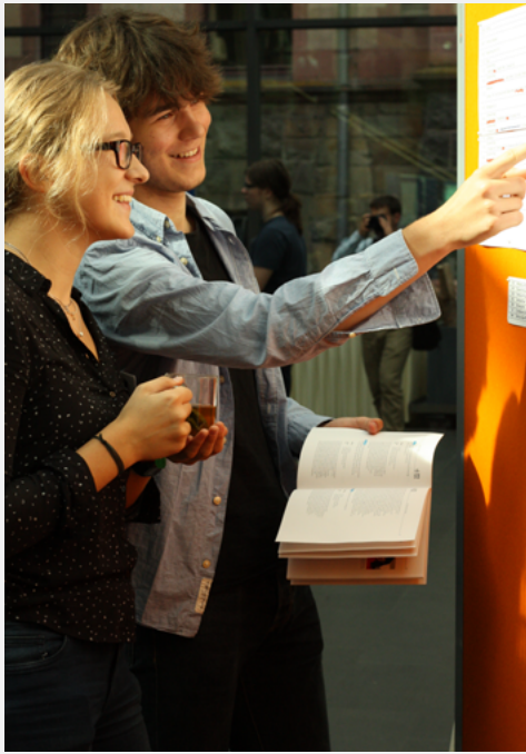
Vor allem die angeregten Gespräche untereinander machten die Veranstaltung zu einem vollen Erfolg.