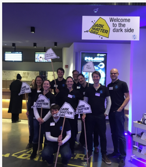
Die Relativitätstheorie ist anwendbarer, als viele denken.