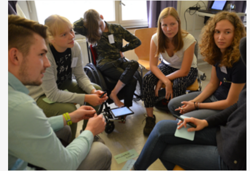
In den einzelnen Arbeitsgruppen der Fellows wurde fleißig diskutiert und Ideen gesammelt.