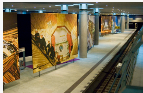
Weltmaschine-Ausstellung vor genau zehn Jahren im U-Bahnhof Bundestag in Berlin