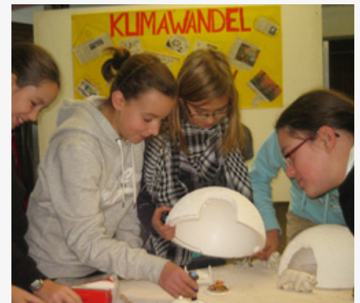
Schüler bauen beim Polartag des Deutschordeogymnasiums in Bad Mergentheim einen Iglu aus Styropor und Würfelzucker.