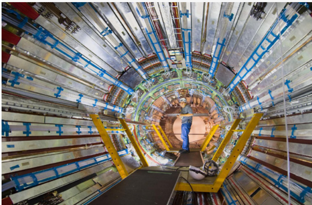
Mit Hochdruck wird derzeit an der Auswertung der Proton-Proton-Kollisionen gearbeitet. Mehr als vierhundert Trillionen Kollisionen fanden allein 2011 statt. Hier zu sehen: die Kryostaten des ATLAS-Solenoid-Magneten.