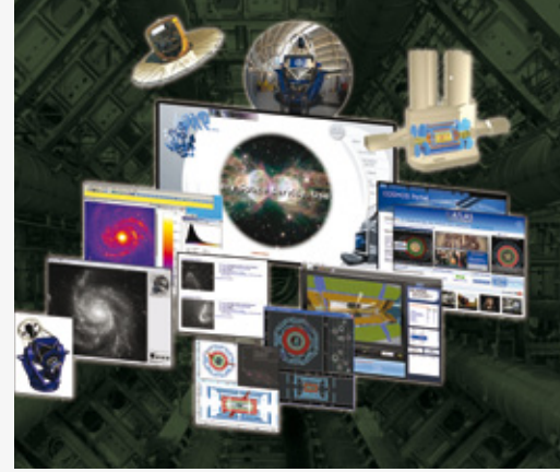
Das EU-Projekt „Discover the Cosmos“ macht moderne Forschung in Teilchenphysik und Astronomie weltweit zugänglich.

www.discoverthecosmos.eu Michael Rockstroh