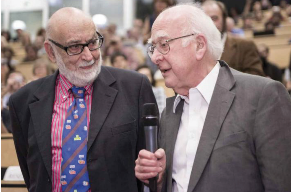
François Englert (links) und Peter Higgs (rechts) am CERN im Juli 2012, als die Entdeckung eines Higgs-Bosons verkündet wurde. Dieses Jahr erhalten sie dafür den Physik-Nobelpreis.