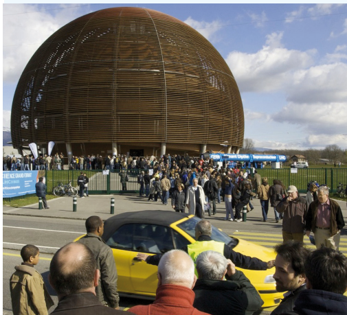
CERN öffnete am 28. und 29. September seine Türen.

Am 28. und 29. September 2013 standen die Türen, Tore und Lastenaufzüge am CERN weit offen: An zwei Tagen der offenen Tür anlässlich der großen Umbau-Betriebspause LS1 besichtigten insgesamt rund 70 000 Menschen das Forschungszentrum. Davon zog es mehr als 20 000 Besucher unter Tage: Die vier großen LHC-Experimente und der