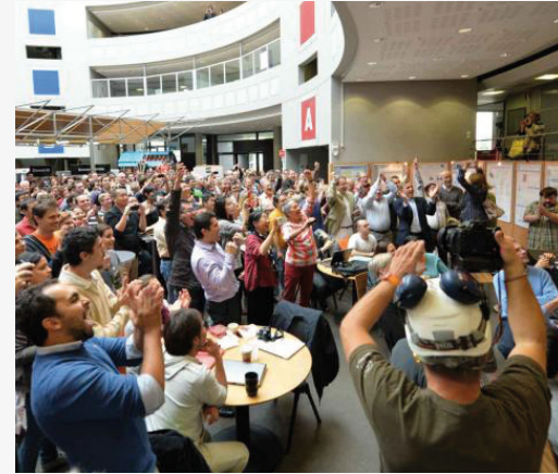
Jubel am CERN bei der Verkündung der diesjährigen Physik-Nobelpreisgewinner